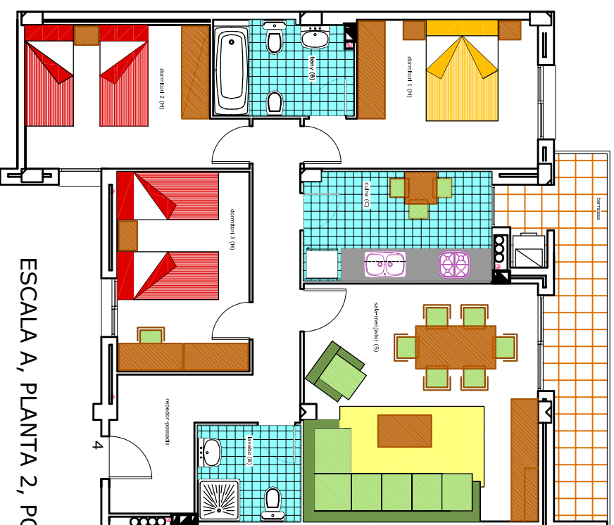
ESCALA A, PLANTA 2, PORTA 4